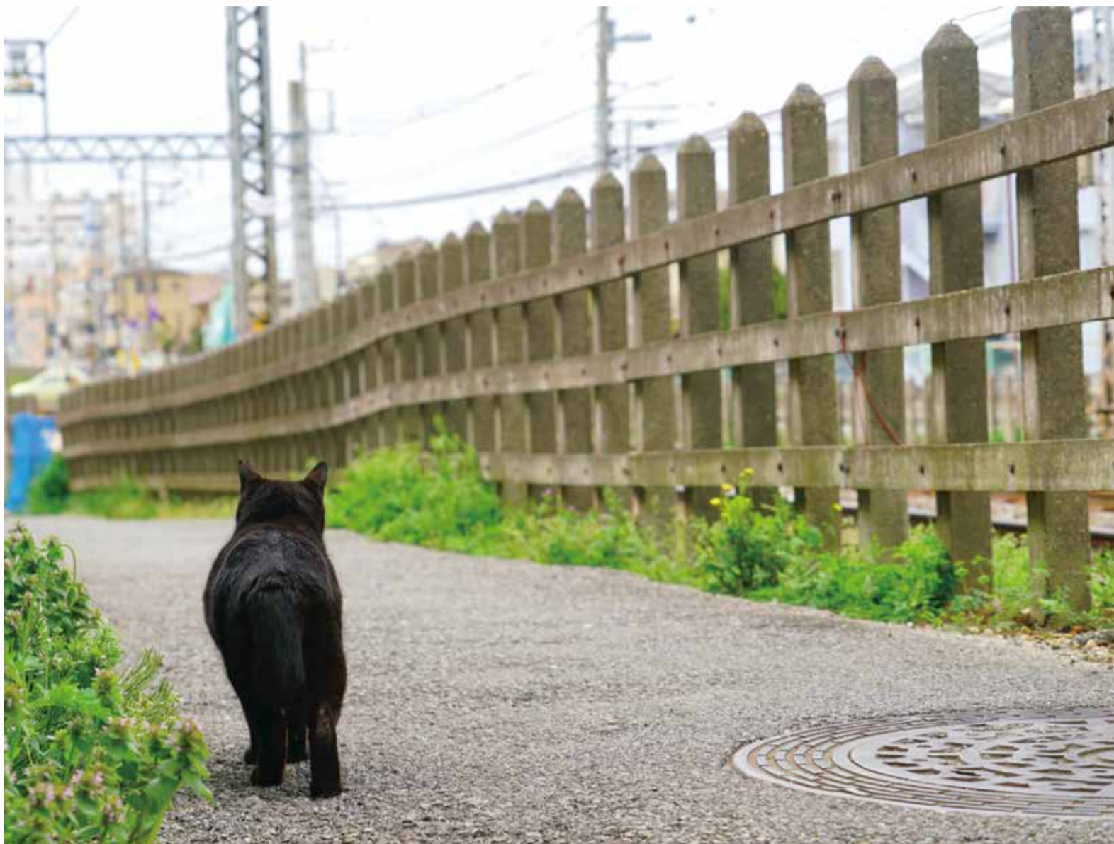
▲人間と猫が共生するために「地域ねこ活動」をしている地域があります。詳しくは、2・3ページに掲載しています

約1万年前から、人間の良きパートナーとして寄り添ってきた猫。日本最古の飼い猫の記録は、平安時代に宇多天皇が可愛がった黒猫とされています。