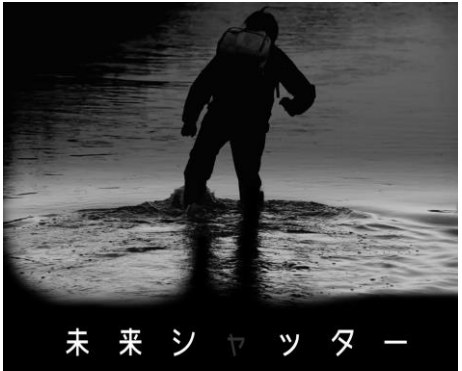
映画『未来シャッター』(NPO 法人ワップフィルム製作)