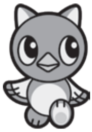
八千代市イメージキャラクター「やっち」