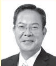
第40代 議長 木下 映実