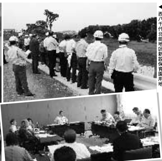
▲西八千代北部地区新設保育園用地