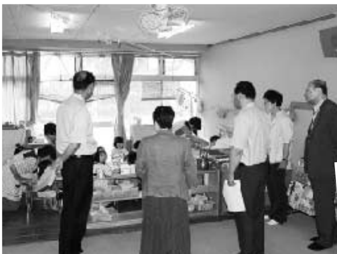
▲民間移管された高津西保育園