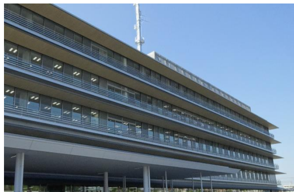
▲ 習志野市役所新庁舎外観

八千代市の大きな課題の1つである庁舎整備事業の参考とするため、平成29年4月30日に竣工したばかりの習志野市役所新庁舎の視察を8月18日に実施し、17名の議員が参加しました。