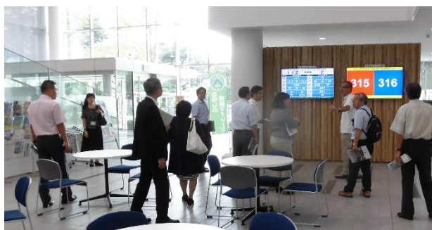
▲ グランドフロア階の市民協働スペース