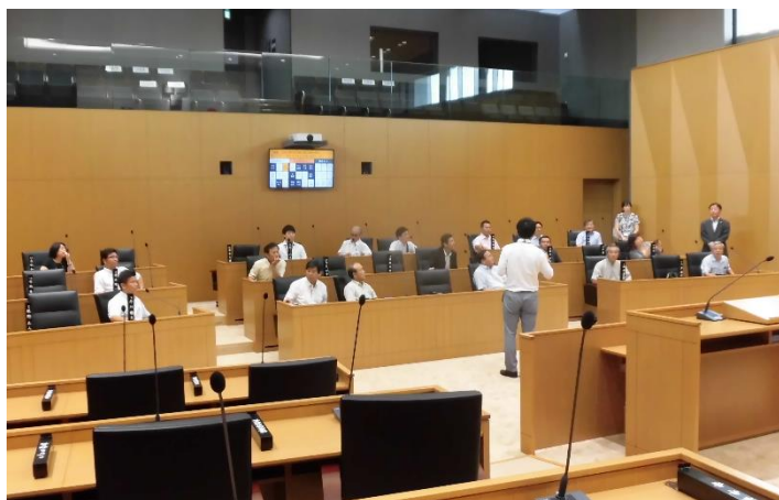
▲ 議場にて採決システムの説明を受ける様子。