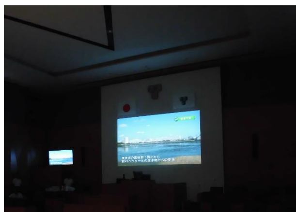
▲ 議場の壁面に映写機で映像を流している様子。 議場の壁面は大型のスクリーンとして活用できるようになっています。