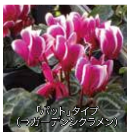
「ポット」タイプ (⇒ガーデンシクラメン)