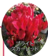
ブライト スカーレット

【範充さん】 基本は私が主で、あとは父です。忙しくなると、妻と母にも手を貸してもらっている感じですね。