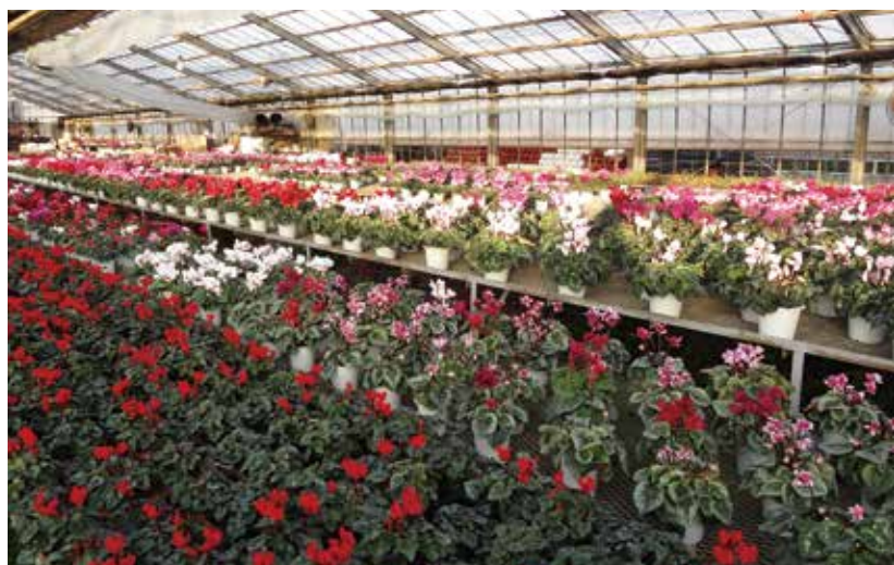
▲ ハウスいっぱいのシクラメン(冬季)