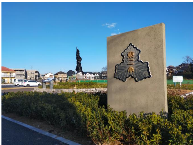
■モニュメントウォール