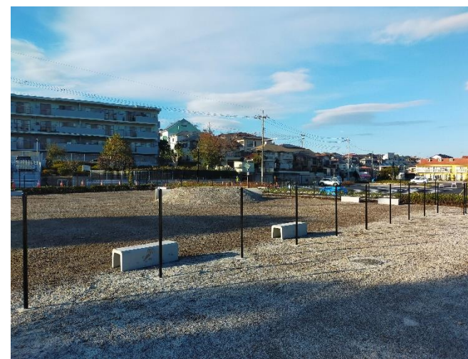
■ドッグラン（工事中）