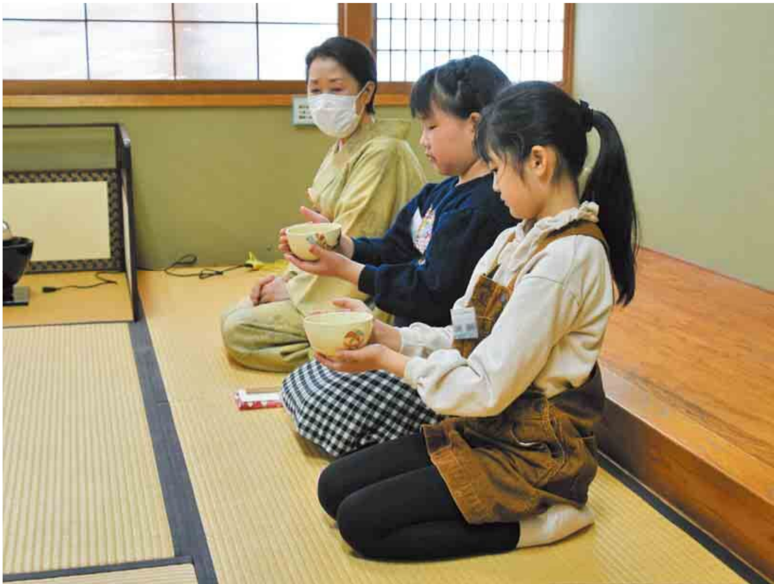
▲作法に沿って茶碗を回し、絵柄を避けてから先生に点ててもらったお茶をいただきます

3月16日に八千代台公民館で子どもの茶道体験講座が開催されました。小学生の子どもたちに、日本の伝統文化である茶道に気軽に触れてもらうことを目的とした講座で、講師から茶室での作法を教わってから、みんなでお菓子とお抹茶をいただきました。先生が点てたお茶を味わった後は、子どもたちがペアになってお互いにお茶を点て合い、茶道の作法について学ぶことができました。