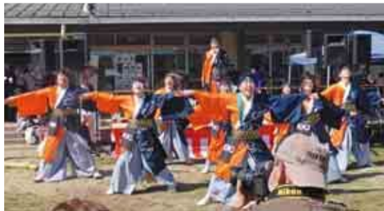
▲YOSAKOI 八千代翼塾の力強い演舞のパフォーマンス

3月2日と3日の2日間、道の駅やちよで八千代新川千本桜まつり2024が開催されました。暖かな陽気のもと、訪れた人は満開となった河津桜を眺めながら遊歩道を散策するなど、思い思いに春のひとときを楽しみました。