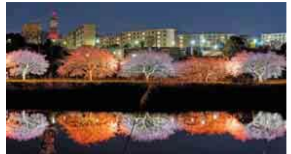
▲ライトアップされた桜が新川に鏡のように映りこみます

農業交流センターの芝生広場では、和太鼓演奏やアイドルステージなどの熱いパフォーマンスが披露されたほか、キッチンカーや源右衛門