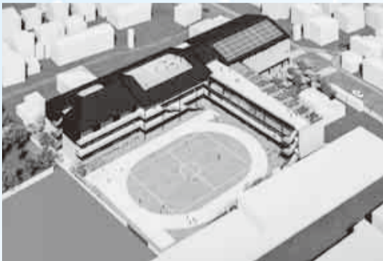
▲みどりが丘小学校分離新設校イメージ

また、八千代総合運動公園市民体育館の長寿命化と庭球場の利便性向上を図るため、主体育室屋根及び天井の改修、空調設備の交換、庭球場の人工芝化などの改修工事を行います。