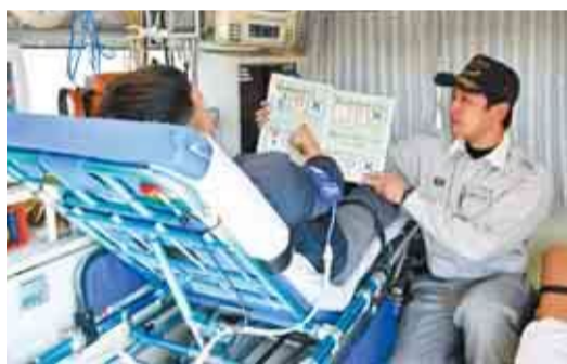
▲ボードを指で差して救急隊に意思を伝えられます

市では、障害者や外国人が救急自動車に乗ったときに救急隊との意思伝達を容易にするため、日本語に加え英語、中国語、ベトナム語、スペイン語の計5か国の言語で書かれたコミュニケーションボードを作成し、市内の救急自動車全車両に設置しました。