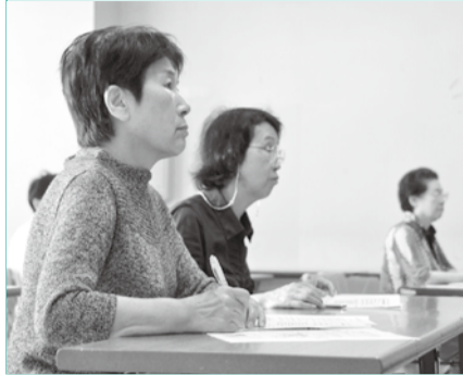
▲公民館などで開催しています

認知症を予防する生活習慣のポイントと、認知症が心配になったときの対応を簡単に楽しく学びませんか。保健師・管理栄養士・理学療法士・歯科衛生士が、認知症について説明し、お口編、食事編、運動編の3つのテーマにそって、元