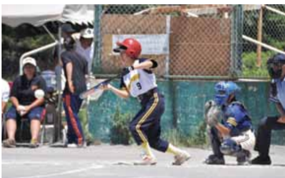
◀普段はあまり機会のない、ほかの世代と対戦します

中学生、高校生、レディースチームが集まり、ソフトボールを通して交流を図る三世代女子ソフトボール大会。三世代の親睦を深めるだけでなく、楽しく頑張る母親の姿を見てもらい、中学生、高校生に生涯を通してスポーツに親しむ気持ちを持ってもらおうと、市ソフトボール協会と市体育協会が主催しています。