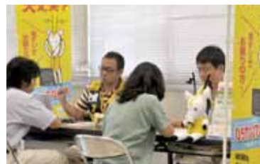
◀デジサポ千葉から派遣された職員が、相談を受けます

8月26日(金)まで、市役所第2別館で地デジ相談会を開催しています。地上デジタル放送に関して分からないことやお困りのことなど、お気軽にご相談ください。土曜・日曜日を除く午前9時30分~正午、午後1時~4時30分に実施しています。