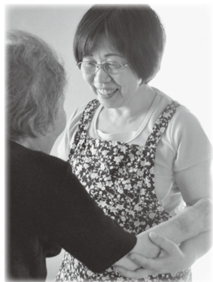
▲笑顔が見られたらリラックスしていますよという合図。「さあ、行きましょうか」

家族の言うことを素直に聞かないときには、周囲から後押ししてもらうといいですね。地域包括支援センターや、