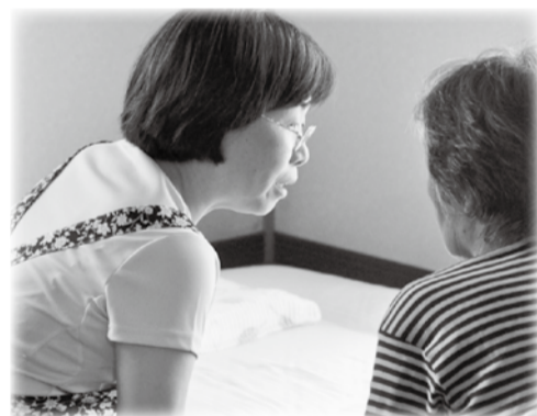
▲話に耳を傾け寄り添えば、何をしたいと思っているのか分かってきます

認知症の場合はおかしいなと思ってから、診断がつくまでに平均で約2年かかっていると言われていています。家族が受診させようとしても、親戚に反対されたり、もし認知症だったらどうし