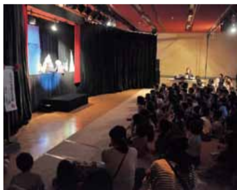
◀6月26日、八千代台文化センターで行われた人形劇まつり

当時来ていた子どもたちが大人になり、今では、次の世代の子どもたちが楽しんでます。