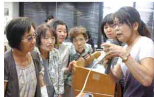
◀スイッチ付きの節電コンセントの説明を熱心に聞く参加者

6月30日、福祉センターで行われたこの講座には30人が参加。今すぐできる具体的な節電方法を学びました。講義の合間には節電クイズがあり、エアコンの除湿が機種によっては冷房より電気を使うと聞くと驚きの声。節電しているつもりでも、間違っていたは無駄になってしまいます。節電方法をもう一度確かめてみませんか。