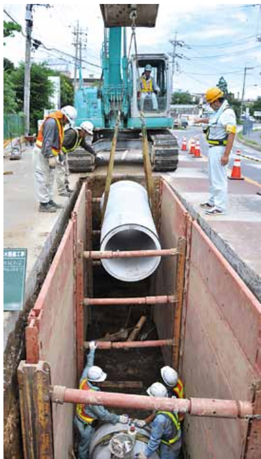
◀地中3メートルに、直径80センチメートルの雨水管を設置(大和田新田)

生活になくなくてはならない水。私たちは毎日たくさんの水を使い、トイレ、洗濯、洗い物などで使った水を流しています。