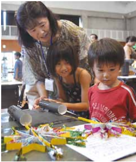
1年生の作品。ゴム力で火花が飛び出します

冷熱体験では、子どもたちが液体窒素の中に風船やゴムボールを入れ、どのような変化があるのか確認したり、凍らせたバナナで釘を打ったりしました。普段は見ることのできないマイナス196℃の世界を間近で体験した子どもたちは、驚きの連続。実験のたびに歓声が上がり、大興奮の様子でした。