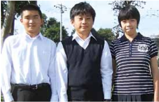
宛名シール貼りなどを行います

10月31日(月)から11月18日(金)の期間、県立八千代特別支援学校の生徒3人が障害者支援課で職場体験実習を行います。これは障害者の就労意欲の向上と障害者雇用への理解を促進するため「障害者自立支援協議会」の提案で昨年からの実施しているもの。