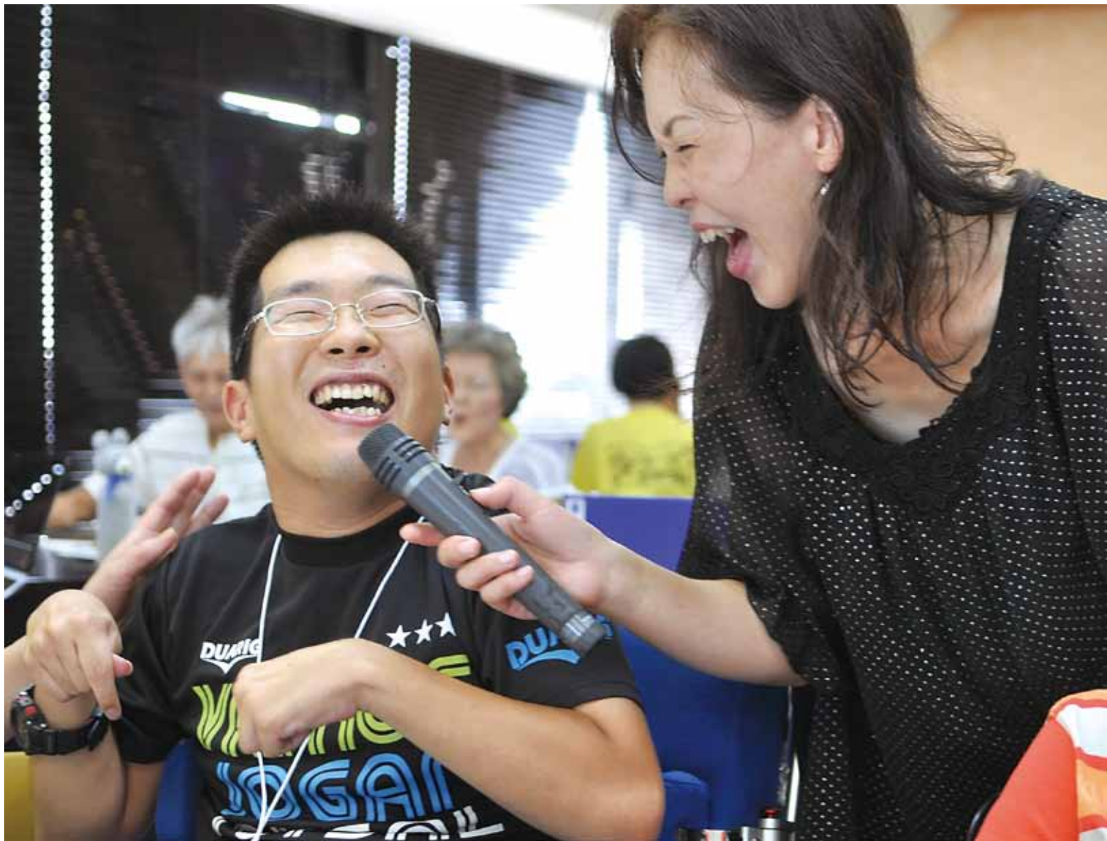
▲みんなの福祉センターまつりでは、「おもちゃの図書館」「みるくとおんがく」「紙芝居・読み聞かせひろば」も開催。直接福祉センター ☎483-1171へ

福祉センターでは、毎月第3土曜日に“みんなの福祉センターまつり”が行われています。その中のひとつ“コーヒーと音楽の集い”は、毎回100人以上が集まる人気の催しです。障害のある人もない人も、コーヒーを飲みながら音楽と一緒に楽しもうと、身体障害者福祉会が昭和61年に開催。しばらく休止していましたが、社会福祉協議会が引き継ぎ形で3年前から再開されました。9月17日、福祉センターには、120人が集まり“学生時代”や“ はば 昇”、“世界に一つだけの花”などを熱唱。「この歌、懐かしいわねえ」と思わず笑顔がこぼれます。ピアノの伴奏と講師の歌声に合わせて、2時間で20曲を歌いあげました。