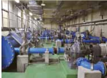
▲新たにポンプ3基を増設しました

今まで、人口増加に対応して、送水ポンプ棟の建設やポンプ設備・受水池の増設などを行ってきました。