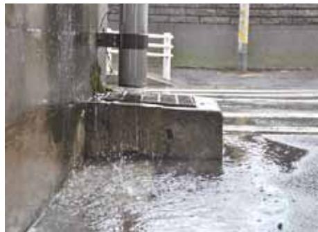
▲雨は雨水管を通して川に流されます