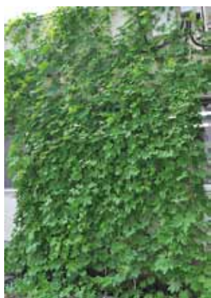
▲米本支所のゴーヤのカーテン

▼展示期間 11月1日(火)正午～6日(日)正午 ▼場所 イオン八千代緑が丘店シヨッピングセンターローズ広場 (環境保全課)