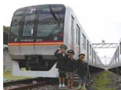
◀制服を着て「はい、ポーズ」

企画課☎(458)0018 ▼問い合わせ 東葉高速鉄道(株)総務部(総合企画課)