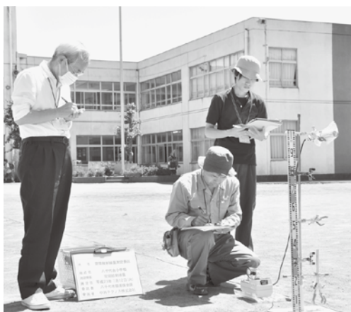
▲空間放射線量測定の様子 7月12日、八千代台小学校

測定結果は、1時間あたり0.05マイクロシーベルトから0.27マイクロシーベルトの範囲であり、この測定値は、文部科学省が福島県で示している放射線低減策を実施する場合の指標である1時間あたり1マイクロシーベルトを下回っています。