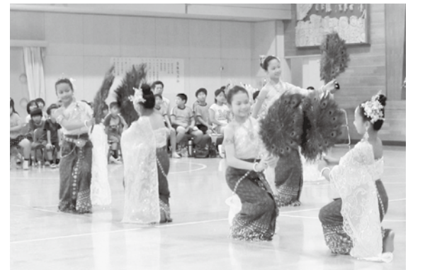
▲米本小学校で伝統舞踊を披露するバンコク子ども親善大使

バンコク子ども親善大使の来訪は、今回で20回目となり、滞在期間中はホームステイや学校訪問、また、八千代子ども親善大使のOG・OBの会「ダイラックアン」との交流を通して、