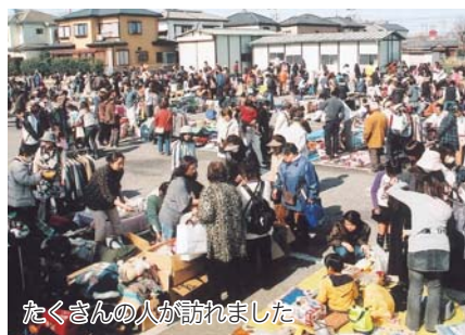
たくさんの方が訪れました

▶申し込み 4月22日(水)消印有効で、往復はがきに住所、氏名、電話番号、詳細な販売品目、参加者人数、返信先を書き、〒276-8501市クリーン推進課内八千代フリーマーケット実行委員会へ郵送。1グループ1通で1区画のみ。複数枚の応募や記載内容不備の物は無効(クリーン推進課)