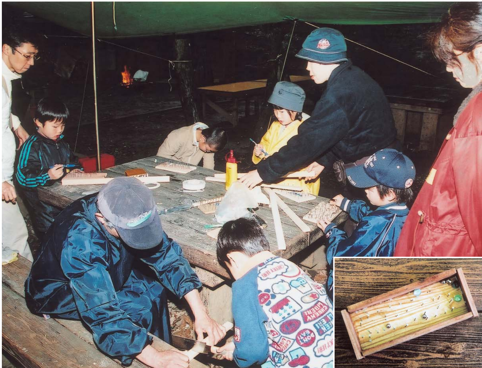
▲ゲーム板の縁を取り付ける子どもたち。右側は、完成したコリントゲーム板

村上にあるガキ大将の森で3月20日、「ガキ大将の森であそぼう」が行われました。NPO法人ガキ大将の森の会が「子どもたちに元気に外で遊んでもらおう」と開いたもので、3歳から10歳までの子どもたち12人と保護者6人が参加。お母さんと一緒にコリントゲーム板を作っていた子は「初めてトンカチやノコギリを使った。まっすぐにクギを打ったり、板を切ったりするのが難しい」とクギを打ち直しながら話していました。このほか、子どもたちは、自分たちで摘んだヨモギを使って団子を作ったり、森の中で遊んだりして1日楽しく過ごしました。