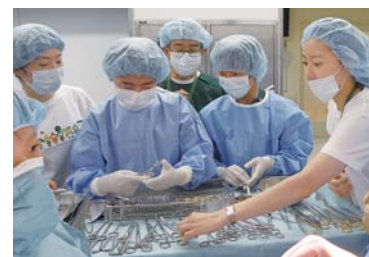
中学生対象の医療現場体験

日時 8月2日(日)午前10時～午後3時(雨天決行) 場所 東京女子医科大学八千代医療センター | 駐車場は混雑しますので公共交通機関をご利用ください 問い合わせ 同センターフェスタ実行委員会 員 458)7146