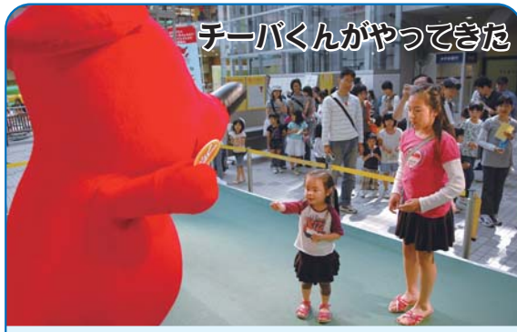
チーバくんがやってきた 6月15日の県民の日に、チーバくんがフルルガーデン八千代に登場。ゆめ半島千葉国体をPRしました。