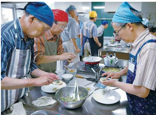
▲きれいに包むのは難しい！

自分で作ればおいしさ倍増 高津公民館の「男の手習い・家庭料理編」 高津公民館では、5月27日から4回の予定で「男の手習い・家庭料理編」を開催しています。この講座は、男性も積極的に自分で料理を作り、自立した