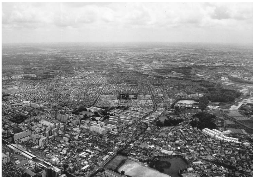
発展を続ける八千代市（勝田台周辺）

が組織全体で環境活動に取り組むことを宣言し、環境施策を総合的に推進することが特徴です。特にCO 2 排出量の削減や廃棄物削減のための3Rの推進、水使用量の削減などに取り組むことが必要となります。また、環境活動計画と、その取り組み実績を「環境活動レポート」として、市民の皆さんに公表することになっています。