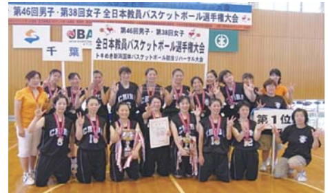
昨年優勝した女子チーム

また、全国から訪れる選手の皆さんを温かく歓迎し、地元へ帰ってから八千代市の良さを紹介してもらえようようにしたいですね。