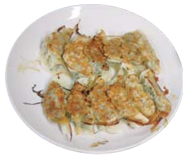
▲アツアツの焼きぎょうざ

試食した参加者は「うまい！」「形はいいけど、味はいけるね」と満足げ。ぜひ家庭でも腕を振ってほしいですね。