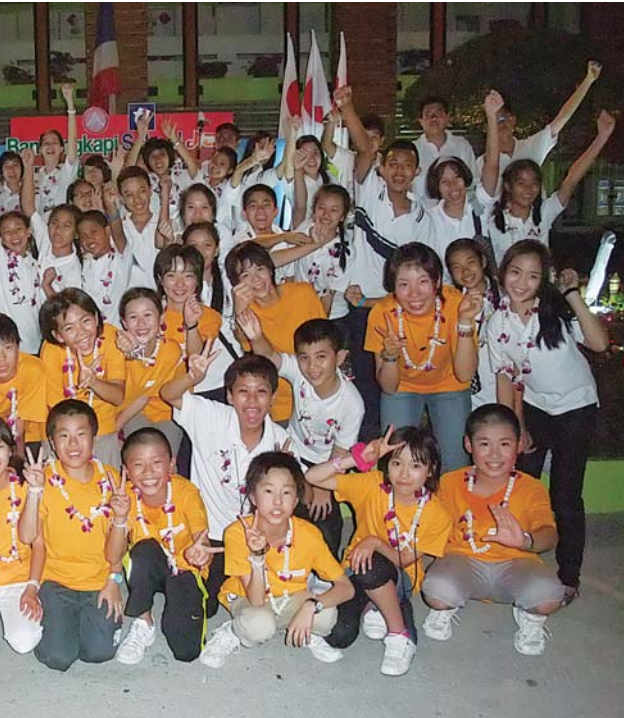
「テップウタイ」と八千代子ども親善大使の交流会

問い合わせは、ゆめ半島千葉国体八千代市実行委員会事務局・国体推進室 市民体育館 内番481-0310 FAX481-0319へ