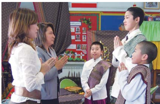
バンコクの学校で、タイ式のあいさつを勉強

国際理解事業としては、毎年中学2年生と小学5年生を対象に国際平和作文コンクールを行っています。(財)日本ユニセフ協会製作のビデオや新聞・テレビを見て、平和・飢餓・環境について考えたことを作文にします。子どもたちは、