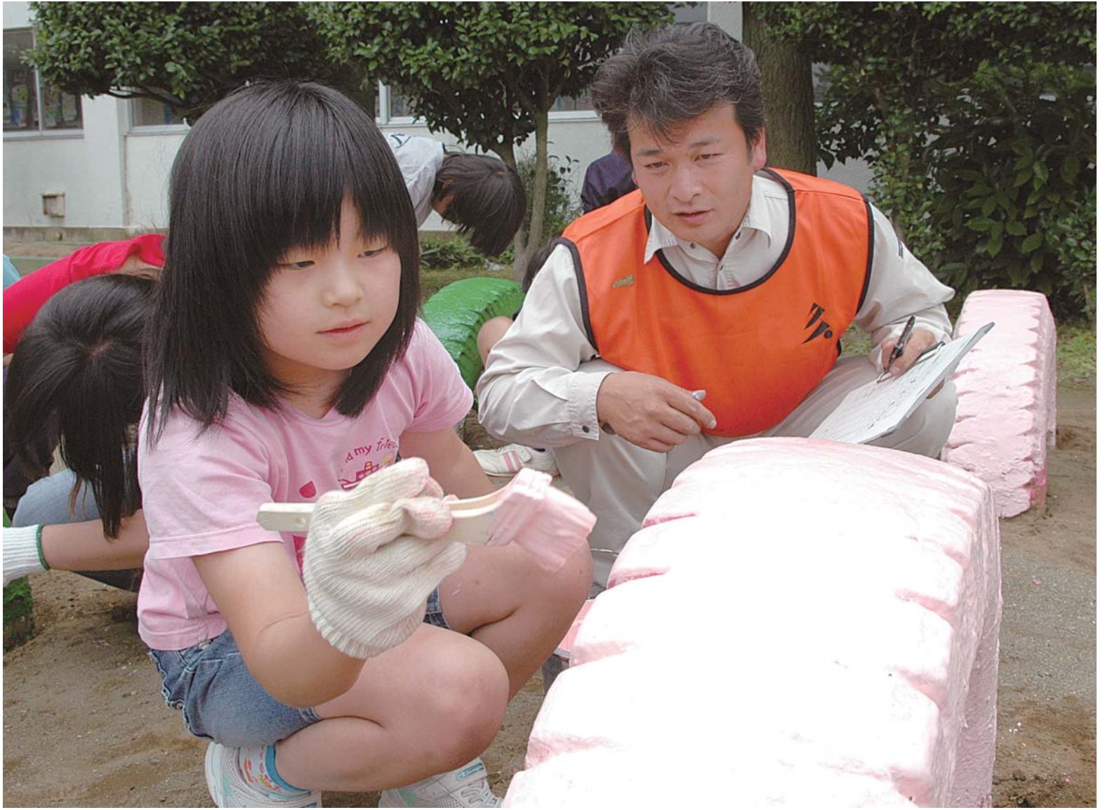
▲「はけは鉛筆を持つように持ってごらん」職人さんの指導の下、真剣な表情でペンキを塗る子どもたち。この活動で使用する物資は、日本ペイント、ちばらぎ塗料、中島商会、小島塗料などの企業が無償で提供しています

6月14日、勝田台小学校で建築塗装部会「匠塗」の皆さんによる「遊具塗替えボランティア・ペイント学校」が開催されました。「匠塗」は、県内の若手一級塗装技能士のグループで、言わば“ペンキ塗りのプロフェッショナル”。「自分たちの技術で地域に恩返しをしたい」と、ボランティアで公園や小学校の遊具の塗替えを行っています。今回、「普段使っている遊具を自分たちの手できれいにし、物を大切に育んでほしい」という思いから、同校4年生以上の子どもたちや保護者有志にもペンキ塗りに参加してもらいました。色が褪せ、土で汚れていた校庭のタイヤ遊具が、子どもたちの手で色鮮やかに生まれ変わりました。