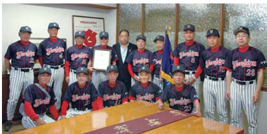
▲表敬訪問した八千代クラブの皆さん