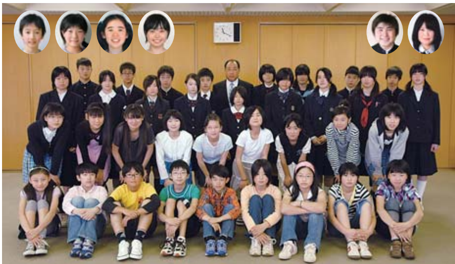
5月9日に市役所で行われた青少年版記者委嘱式で

21年度の広報青少年版記者を、各学校から推薦された次の41人の皆さんにお願いしました。記者の皆さんには一年間、学校での出来事や話題、周りの友達が考えていることを報告してもらいます。また、新聞やニュースで話題になっていることについて、意見や感想を発表してもらいます。今年度の広報青少年版は、今号、11月1日号、3月1日号に掲載。