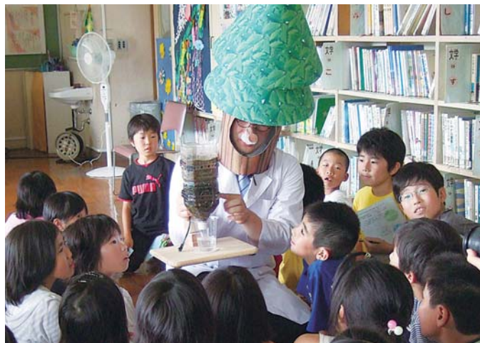
▲ろ過装置から出てきた透明な水に驚く子どもたち

6月29日、西高津小学校で「環境の訪問授業」が行われました。これは、県内の清涼飲料会社が清涼飲料と関わりの深い水にスポットを当て、生命の源となる森の大切さを子ども