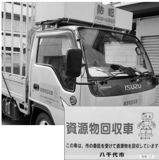
写真2/市の委託業者の資源物回収車にはこのシートを貼付

また、どのような人でも、政治家や後援団体に対し、あいさつを目的とする有料広告を威迫して求めることは、罰則の対象になります。