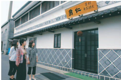
神崎酒造蔵を取材する女性版記者

皆さんが普段食べている白米の精米歩合はおよそ90パーセントです。日本酒を造るときは、米の外側に含まれる油分やたんぱく質が味を落としてしまうので、さらにお米を精米します。日本酒の最高峰といわれる「大吟醸酒」の精米歩合は50パーセント以下。玄米を半分以上削ってしまいます。磨けば磨くほど風味のよいお酒ができるといわれますが、仕込みに必要な米の量が増えてしまうため、高価な物になってしまいます。