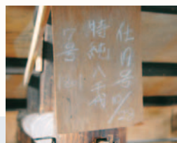
仕込みの識別表示