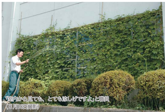
「室内から見ても、とても涼しげですよ」と職員(8月18日撮影)

「緑のカーテン」とは壁面緑化のこと。つる状に伸びる植物で建物の壁面を覆うことにより、建物に直接当たる日光を和らげ、建物内部の温度上昇を抑えます。近年、ヒートアイランド対策、省エネ対策として注目を集めています。