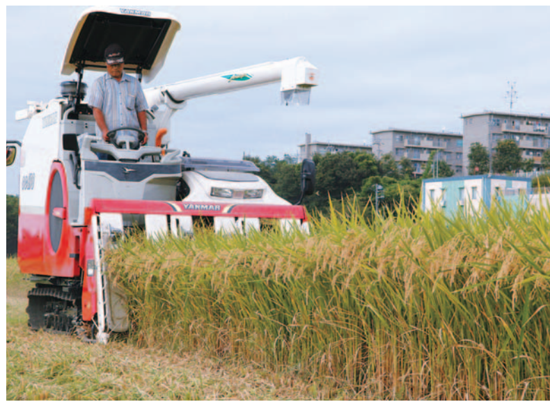
総の舞を収穫。来年秋には八千代桜に姿を変え、店頭に並びます（米本地区で8月27日に撮影）

八千代産のお米で作られた地酒「八千代桜」が誕生したのは平成7年。誕生から15年目を迎えます。今年の八千代桜は、10月7日(水)から販売される予定です。今回の女性版では、八千代桜誕生の切っ掛けや米本地区で収穫したお米が、どのように日本酒になるのかを追ってみました。