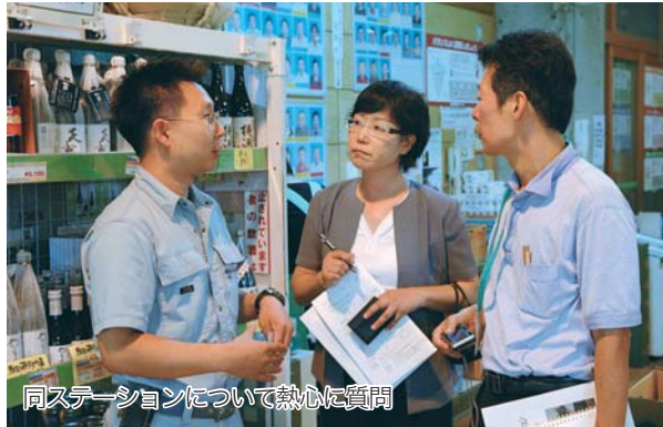
同ステーションについて熱心に質問

韓国農村振興庁職員がふるさとステーションなどを視察 8月19日、韓国農村振興庁農村支援局の職員2人(写真中央、右)が、ふるさとステーションや市内の梨農家などを訪問。八千代の農産物の流通や販売方法、施設などについて視察しました。