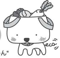
キャラクター“もらわん”