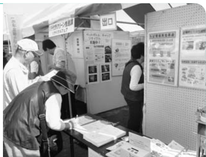
ごみ処理の流れなどを展示

10月17日(土)・18日(日)に総合運動公園で行われる「八千代どーんと祭」で、リサイクルに関するパネルやリサイクル品の展示を行います。両日ともアンケートに答えていただいた先着500人に、粗品を差し上げます。