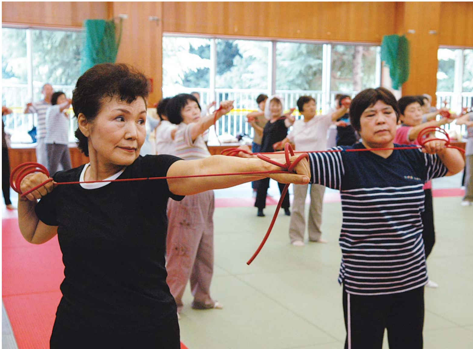
▲8月16日に行われた同教室で、チューブを使ったストレッチを行う参加者。「ゆったりした運動に見えるけれど、結構きついんですよ！ たっぷり汗をかけます」とにっこり

4月から9月まで、全12回の日程で行われた市民体育館の「シルバー健康体操教室」。これは60歳以上の人を対象にした講座で、最高齢の参加者は81歳。毎回約100人が参加しました。「健康づくりのための体操で一番大切なのは、体が気持ちいい！」と感じること」と講師の国際武道大学・中島一郎教授。参加者は、ストレッチや沖縄舞踊の動きを基に考案された体操などを行い、汗を流しました。市内に住む60歳以上の人は年々増え、3月末日現在で約4万9,700人。いつまでも心身共に健康で、いきいきとした生活を送るためにも、このような講座に参加し、健康づくり、そして仲間づくりをしてはいかがでしょうか。