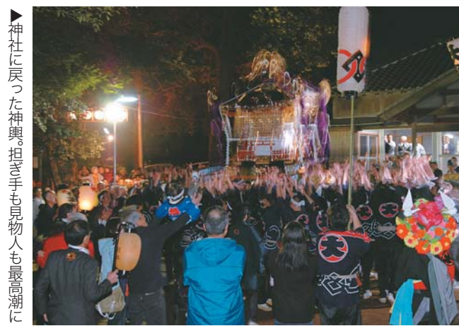
▶神社に戻った神輿。担ぎ手も見物人も最高潮に