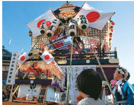
▲山車を見上げて「とっても大きいね。時平神社(大和田)の山車は歩道橋の下を通れないほど」