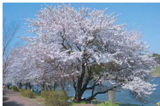
新川の桜。季節によってツツジやカンナも咲きます

市では皆さんから寄せられた情報などをまとめた「やちよ良いところマップ・農産物販売施設等紹介マップ」を市ホームページに掲載しています。「良いところ情報一覧」はカテゴリ別・かな別に市内の風景などの情報を探すことができます。また、「農産物直売所一覧」では梨や野菜など市内54か所の直売所を検索できます。詳しくは市ホームページまたは産業政策課、農政課へ。