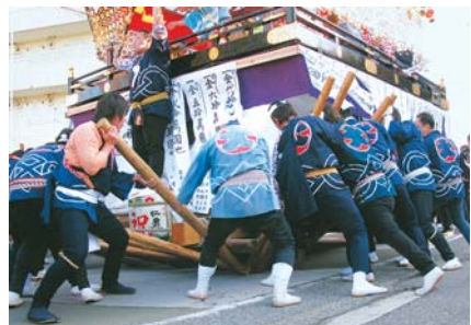
▲テコ棒を差し込み、重たい山車を方向転換