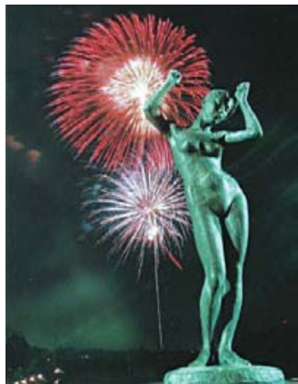
八千代ふるさと親子祭。今年は約20万5,000人が来場

八千代には「新川堤の桜」や「八千代ふるさと親子祭」など、他市にも誇れる風景やイベントがたくさんあります。市では八千代の魅力や良い所を発見し、発信することを目的に「やちよ