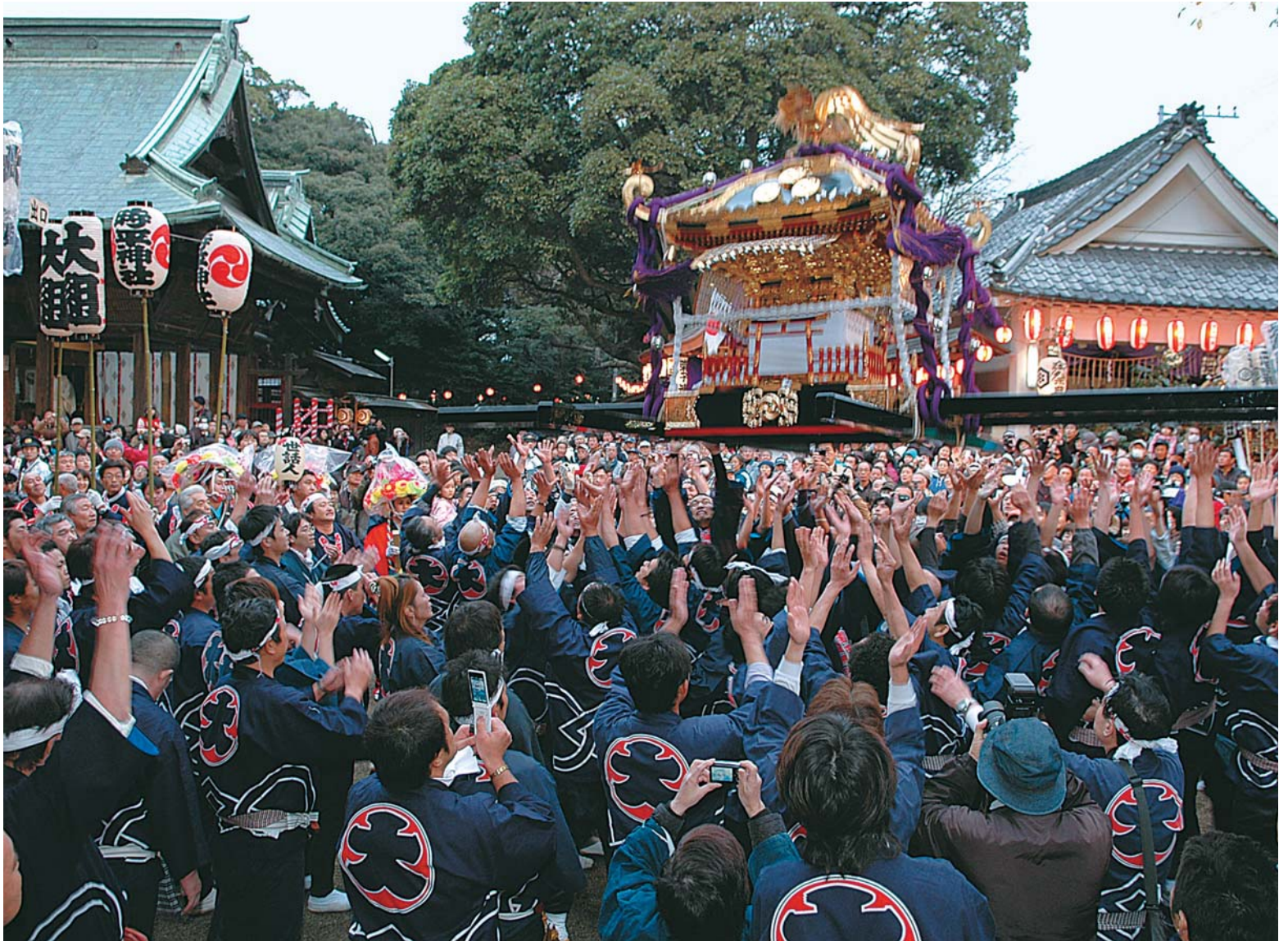
▲平成16年に県無形民俗文化財に指定されてから初めての開催。神輿が高く上がるたび、二宮神社の境内では大きな拍手と歓声がわきました

室町時代から560年以上続いている下総三山の七年祭り。移り変わる長い歴史の中で、昔ながらのしきたりを守りながら受け継がれてきました。丑年と未年の11月に、船橋・千葉・習志野・八千代の九つの神社の神輿が勢ぞろいして安産祈願とお礼を行います。八千代市からは時平神社(大和田・萱田町)と高津比(高津)神社(高津)が参加。11月22日の安産御礼大祭では、各神社の神輿が二宮神社(船橋市三山)近くの神揃場に集合し、威勢のいい掛け声とともに二宮神社へ昇殿しました。この日は小雨が降る寒空でしたが、勇壮な神輿を一目見ようと集まった人たちの拍手と歓声で、周囲は熱気に包まれていました。