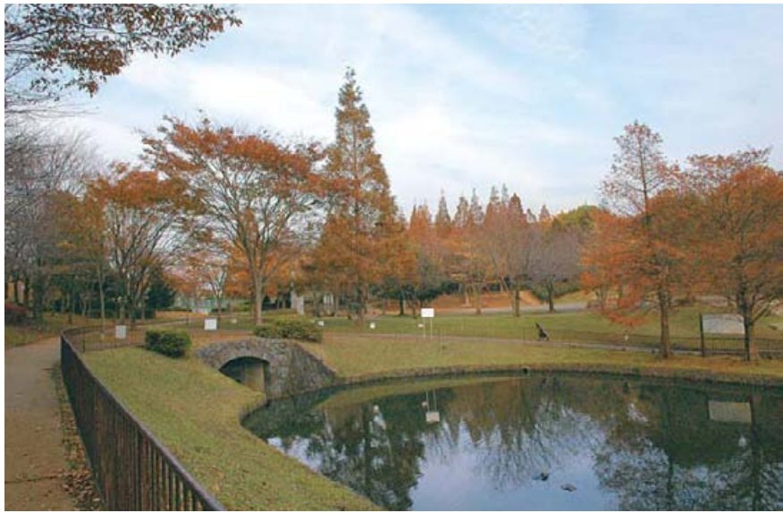
萱田地区公園 初夏には白と赤の2色の睡蓮を見ることが出来ます