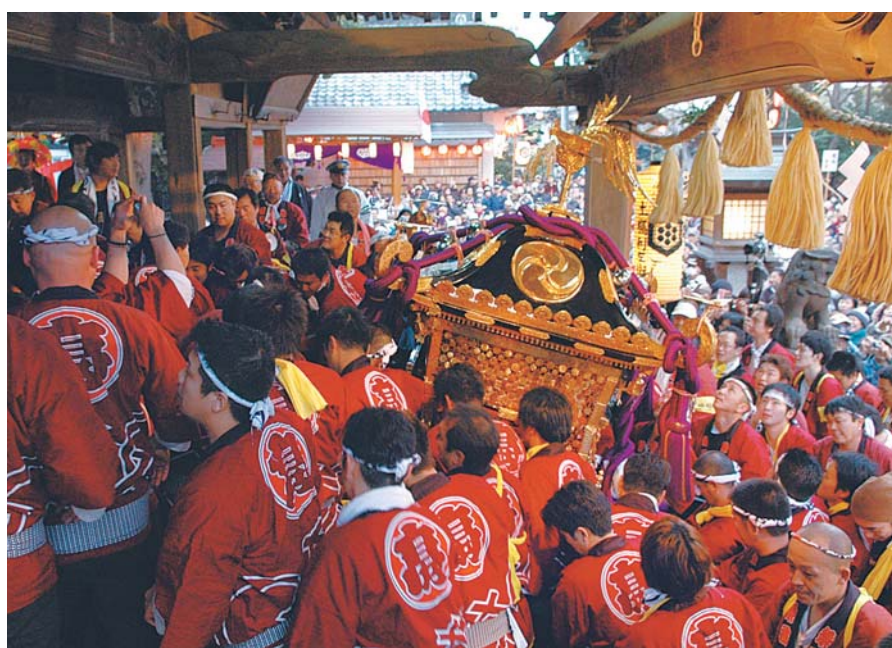
▲二宮神社に「昇殿」する高津比咩神社の神輿と担ぎ手。拝殿にぶつからないよう慎重に進みます

11月23日、時平神社(大和田)の山車と時平神社(萱田町)の神輿・山車、高津比咩神社の神輿・屋台が地元を練り歩き、氏子の家を順番に回りました。門先でおひねりが飛ぶと威勢よくもまれる神輿。担ぎ手たちの掛け声に合わせ、高く舞い上がりました。また、この日は地元の子どもたちも参加。大人と一緒に山車や屋台を引く姿が見られました。将来、この子どもたちの中からも担ぎ手が生まれ、伝統ある祭りが次の世代へと受け継がれていくことでしょう。