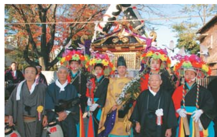
▲神主と世話人、華やかな「金棒」