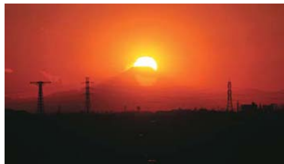
市役所屋上からのダイヤモンド富士

千葉のそら みんなの力で さわやかに 冬は空気がよどみやすく、一年の中で最も大気汚染が進行する季節です。石油ストーブなどの暖房器具や自動車から出る排気ガスには、大気汚染の原因となる窒素酸化物などが含まれています。これらの排出量を削減するため、次のことに協力をお願いします。 ・太陽光発電など自然エネルギーを活用する