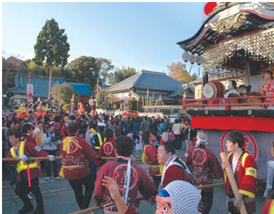
▲地元を練り歩く「花流し」(高津地区)