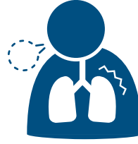
सास फेर्न गाह्रो

मान्छे अनुसार लक्षणहरूको गम्भीरता फरक हुने हुनाले कुनै लक्षण गम्भीर लागेमा, तुरुन्तै परामर्श लिनुहोस्।